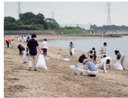
1時間ほどで約2.5トンのゴミを回収

7月4日、美しい瀬戸内海を守るため、海浜の清掃活動「リフレッシュ瀬戸内」を高須海岸で実施。西条市海事振興会や地元の高田自治会、市内企業・団体などから約350人が参加し、力を合わせてゴミを拾いました。