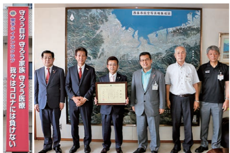
6月29日に感謝状贈呈式を開催