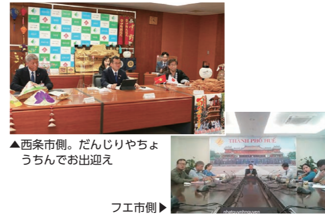
▲西条市側。だんじりやちようちんでお出迎え

5月31日、友好都市のベトナム・フエ市のホアンハイミン人民委員会委員長とオンラインでトップ会談を開催。フエ市の災害の影響や、コロナの状況などについて話し合いが行われました。今後も文化・芸術などさまざまな分野で、さらなる友好交流を深めます。