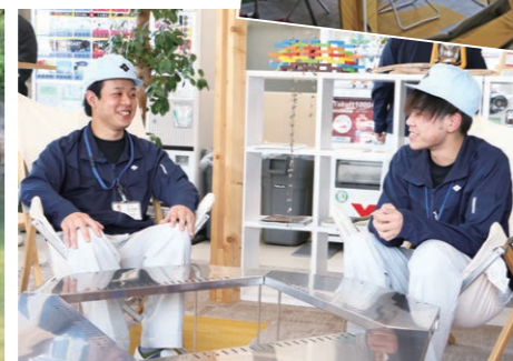
▲自然の中にあるような休憩所