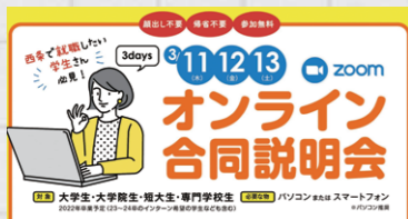
説明会は令和3年3月11日～13日に実施

2022年卒業予定の大学生や短大生を対象としたオンライン説明会の見逃し動画を配信。 (市内19社が参加)