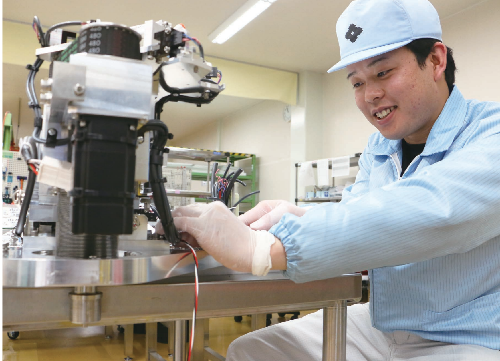
▲難しい図面を見ながら、部品を組み立てます