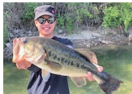
▲休日は釣りでリフレッシュ