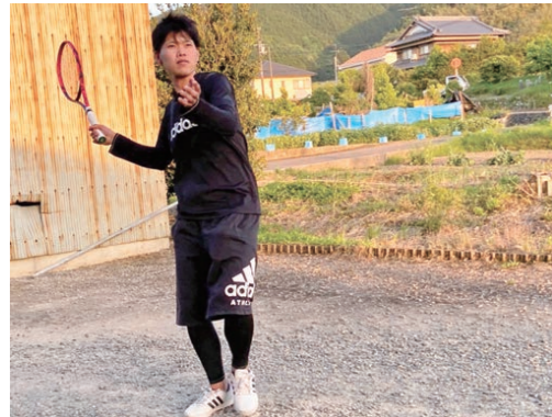
▲気分転換は家族と過ごすこと。テニスの練習に付き合うことも