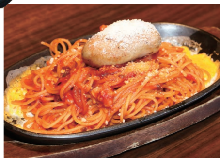
▲人気の「愛媛西条てっぴんナポリタン」