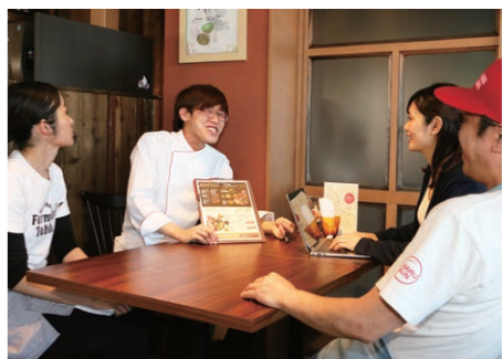
▲メニューの企画をスタッフと行います