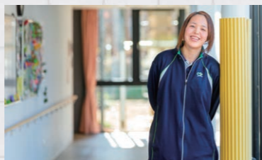
5月14日現在、7社を紹介中

市の魅力発信ポータルサイト「LOVE SAJO」で、市内で活躍する若手社員や社長のインタビュー動画を配信。