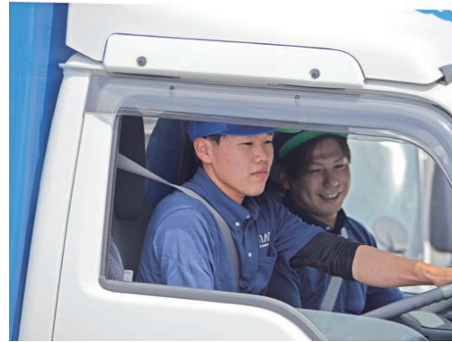
▲大きな事故もなく、安全運転に努めています

これから、高校生の就職活動が本格化する時期。 就職を考えている皆さんに、地元で輝く若手社員たちから、今がんばっていることや、自分らしく働くヒントを教えてくださいました。誰かの笑顔のために、自分の夢のために汗を流す西条の若者の姿に、大人たちも元気をもらえます。