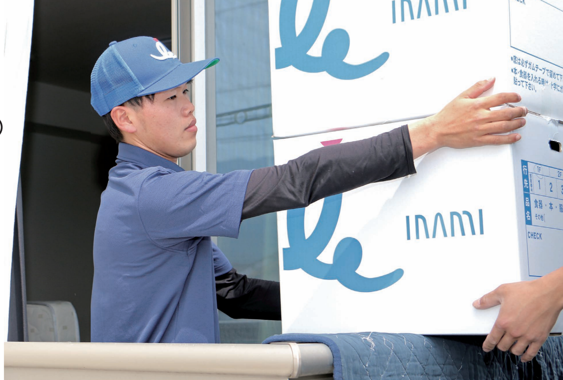
▲お客様の大事な荷物を、仲間と力を合わせて運びます

少しのきっかけで現場が和み、作業もはかどります」。 「長距離作業も多く、いろいろなサービスエリアに寄るんですけど、大好物のカツ丼を毎回食べています。こっそりランキングを付けるのが、隠れブームです」と引越し業ならではの楽しみも教えてくださいました。