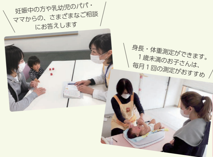
妊娠中の方や乳幼児のパパ・ママからの、さまざまなご相談にお答えします

新型コロナウイルス感染症の影響で、掲載内容は変更場合があります。最新情報は市ホームページをご確認ください。