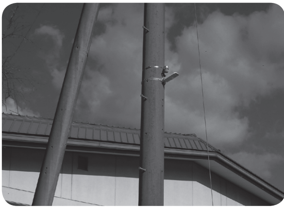
地域の安全を守る防犯灯

A 令和4年度をもって補助制 度は廃止される予定である が、四国電力株式会社からの防 犯灯の寄贈や、防犯協会が防犯 灯の設置に関する補助制度を設 けているため、各種制度の活用 をお願いしたいと考えている。