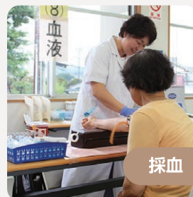
健康診査での血液検査の様子