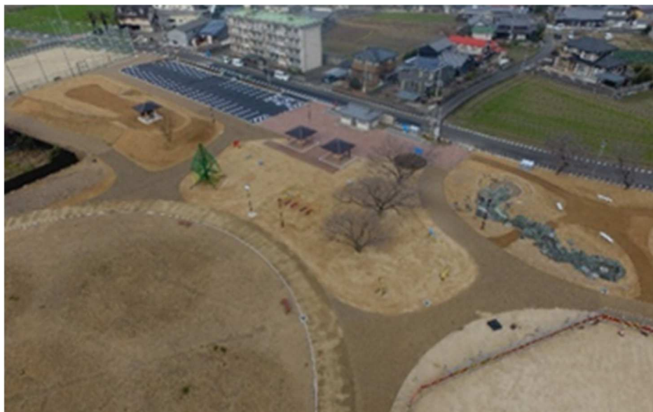
上空から見た 公園の様子