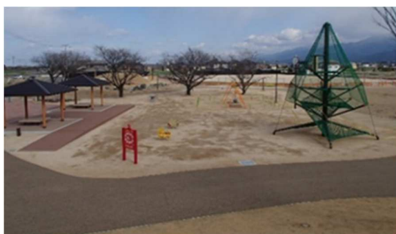
憩いの丘から見た ちびっこ広場