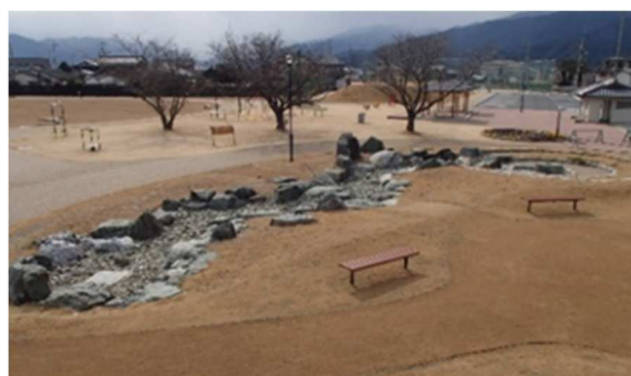
自然の広場にある せせらぎ