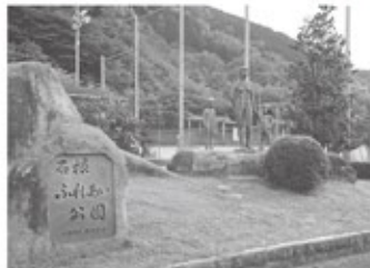
石根ふれあい公園シンボルゾーン

「人と人のふれあい」「自然と人のふれあい」をテーマに地域住民の安らぎと憩いの広場として、幅広い年齢層の方が利用できるように整備されたのが、石根ふれあい公園です。