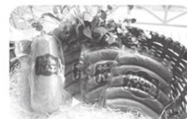
【特産品例】自家製ハム・ソーセージセット (農林水産大臣賞受賞の自家生産のブランド豚)