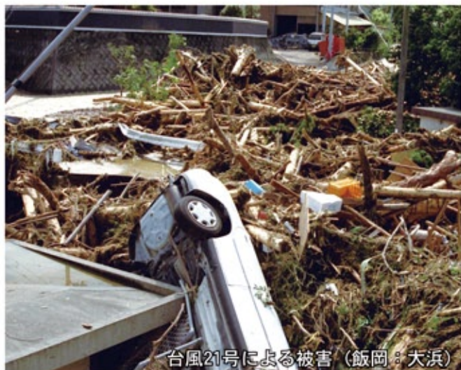
台風21号による被害 (飯岡: 大浜)

■ 問合せ 市庁舎新館5階 危機管理課防災連携係 TEL0897-52-1267