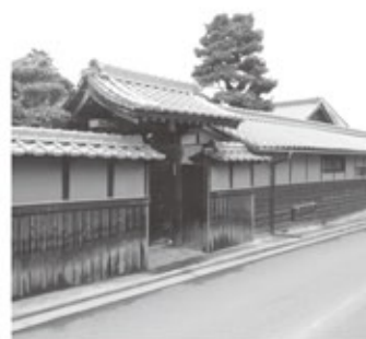
▲石鐘酒造株式会社

「とにかく酒にしなければとの思いから夜も眠れない日々が続き、素人の酒造りと揶揄さ