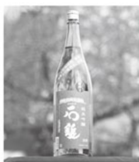
▲代表銘柄「石鐘緑ラベル」

今後市内企業が取り組む事業活動に対し積極的な支援を行っていきます。ぜひ、ご利用ください。