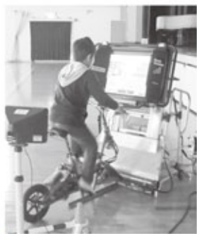
▲自転車シミュレーター