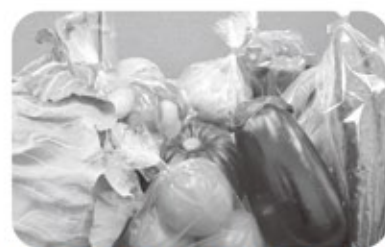
【特産品例】ときめきパック (農産物詰め合わせ)