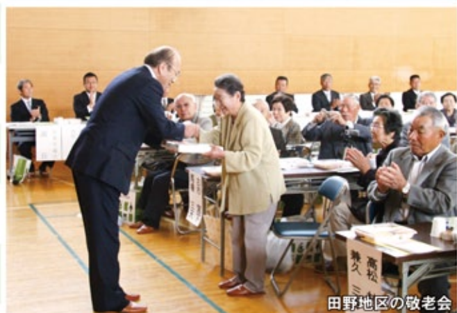
田野地区の敬老会

ご高齢の方々の長寿を祝う敬老会が丹原地区の5会場で開催されました。地元の婦人会や自治会の皆さんのおもてなしや子どもたちのステージで、参加された皆さんは楽しい春のひとときを過ごしていました。