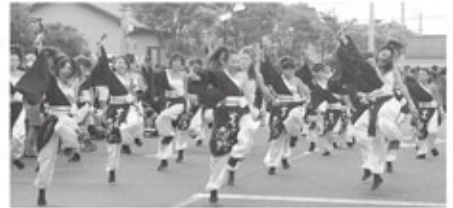
昨年のダンス夏彩祭

今年の夏も、熱気あふれるダンスを「夏彩祭2014」で披露してくれることでしょう。