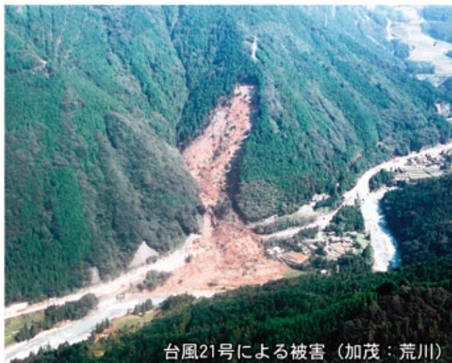
台風21号による被害 (加茂: 荒川)