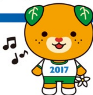
えひめ国体マスコット「みきゃん」

このイメージソング「えがおは君のためにある」は、愛顔つなぐえひめ国体ホームページからダウンロードできます。【URL】 http://www.ehimekokutai2017.jp/