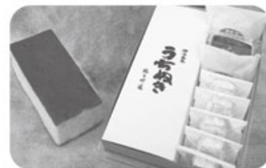
【特産品例】西条産 こだわりの逸品詰め合わせ (地酒を使ったカステラなど)