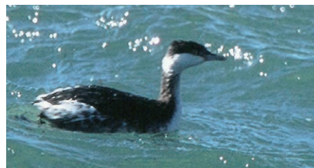
ミミカイツブリ（冬鳥）

全長33cm、ユーラシア大陸から北米大陸の亜寒帯地方で繁殖し、冬期温帯地方に南下、日本では北海道から九州の沿岸、大きい川の河口で見られます。渡来数が少なく、よく潜るため似ているハジロカイツブリとの識別が難しい鳥です。西条では2005年1月に加茂川河口で愛鳥家によって初めて撮影され、その後も数例の観察記録があるだけの珍鳥です。