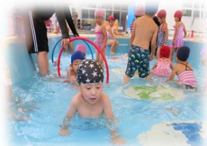
さくらんぼの木の下で