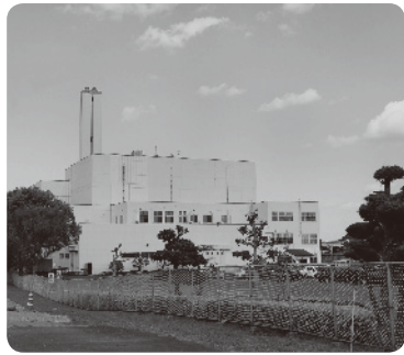
現在稼働中の道前クリーンセンター

ごみ処理をめぐっては、国が都道府県に対し、市町村の広域連携による施設の統廃合や共同維持管理などの計画を定めるよう求めている。県下では5ブロックに分かれて協議することとなり、既に協議を始めた市町もあると聞いているが、本市における広域化について、どのように考えているのか。