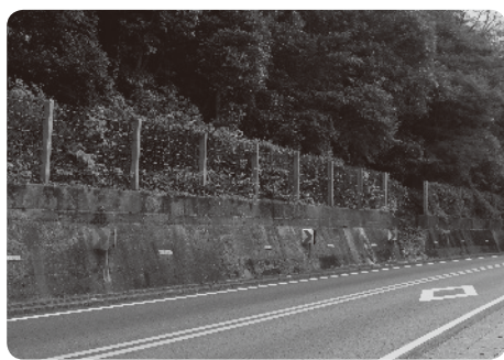
桜三里の落石防護対策箇所

丹原町湯谷口・千原地区において、地滑りが発生しうる箇所が多く存在しており、国土交通省が実施した調査でも、両地区において表層滑りなどの危険性が指摘されている。地滑りなどが発生し、国道11号が遮断された場合、本市の経済活動や市民生活に影響を及ぼすこととなるため、国土交通省に対してこれまでの調査結果を開示願うとともに、地滑り対策について要望すべきと思うが、どのように考えているのか。