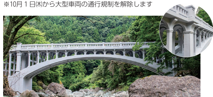
▲石鎧登山ロープウェイ山麓下谷駅を過ぎたところにあります

歴史的価値とデザイン性が評価され、平成17年に土木学会の選奨土木遺産に認定された「大宮橋」。平成27年の定期点検で損傷が確認され、早期対策が必要になりました。その後、貴重な財産を後世に残すため、有識者の先生に助言をいただきながら修繕を進め、9月30日(水)に修繕工事が完了します。 ※10月1日(木)から大型車両の通行規制を解除します