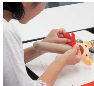
布のおもちゃ作り

●おもちゃ図書館ボランティア講座 ▼日時 10月12日(月)・26日(月) 13時30分～15時10分 ▼場所 総合福祉センター ▼内容 布のおもちゃ作り、おもちゃ図書館ボランティアの紹介など。 ▼定員 15人 ●ボランティア体験講座 ▼日時 11月5日(木) 10時～11時50分