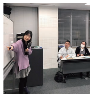
語学能力を身に付けよう

外国語講座 ▼対象 7割以上の受講が可能で次のいずれかに該当する方 ○市内に在住・通勤する方 ○西条市国際交流協会会員 ●英語講座「MRJのイングリッシュルーム」 ▼期間 11月～翌年5月 (各15回) ▼曜日・時間 ○初級A 土曜日 17時30分～19時 ○初級B 火曜日 18時～19時30分 ○中級 火曜日 19時45分～21時15分 ※専門的な語学講座ではありません。 ※初級A・Bのレッスン内容は同じです。 ▼受講料 7000円 (国際交流協会会員は5000円)