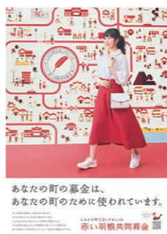
あなたの町の募金は、あなたの町のために使われています。

▼期間 10月1日(木)～12月31日(木) 西条市社会福祉協議会 Tel.0898-64-2600 ▼法定検査 保守点検や清掃が適正に行われ、浄化槽の機能が正しく発揮されているかを確認します。(公社)愛媛県浄化槽協会(Tel.089-923-9313)が行います。 ▼浄化槽を廃止するときは 地区の担当者や依頼し、汚泥などの引き抜き後に最終清掃してください。浄化槽内に残る汚泥は一般廃棄物です。最終清掃せずに地下浸透させると、公共下水道開始区域以外の地域で、10人槽以下の家庭用の合併処理浄化槽を毎年適正に維持管理している管理者に対し1基1年度当たり1万円を補助します。初回申請から10年間補助し、毎年申請が必要です。 市庁舎本館2階 下水道業務課 Tel.0897-52-1461