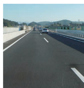
規制期間中はご協力を！

●松山自動車道 いよ西条IC ▼規制日時 10月19日(月)～23日(金) (予備日 26日(月)～27日(火)) 20時～翌朝6時 ●今治小松自動車道 ▼規制日時 11月24日(火)～12月4日(金) 19時～翌朝6時 ※口座振替利用者は、納期限日の残高にご注意ください。