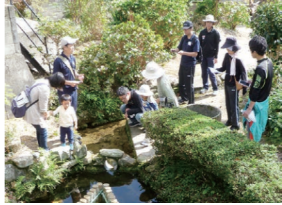
生き物の行動や生態を学べます