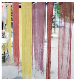
季節の色を感じる草木染

独身者の親向け ライフプランセミナー ▼対象 20代～30代の独身者の親、独身者を応援したい方など ▼日時 10月31日(土) 13時30分～15時 ※個別相談会 (15時～16時30分) も実施。 ▼場所 新居浜市女性総合センター ▼定員 30人