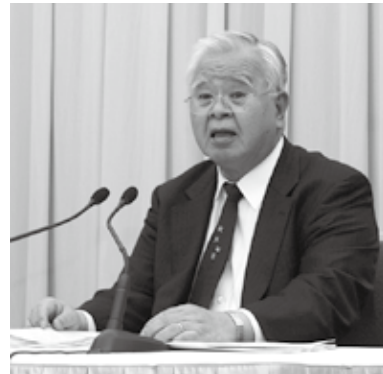
▲実証都市に選ばれた都市名を発表する日本経団連の米倉会長（3月7日の日本経団連定例記者会見にて）