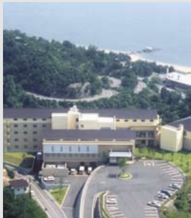
瀬戸内海国立公園の拠点施設として「自然とのふれあい」の機会を提供しています

昭和40年に国民休暇村として開館し、その後、平成15年に全館リニューアルをされたこの施設は、財団法人休暇村協会が運営する公共の宿です。