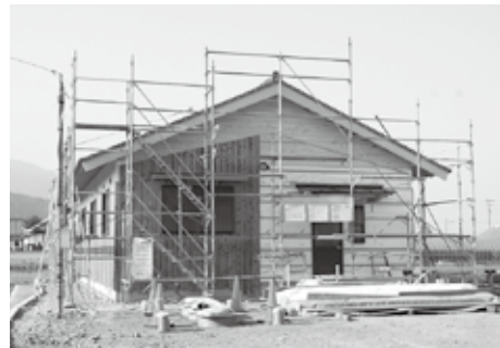
▲コミュニティ施設整備事業費補助金（馬場集会所）