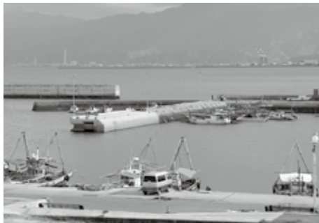
▲河原津漁港整備事業