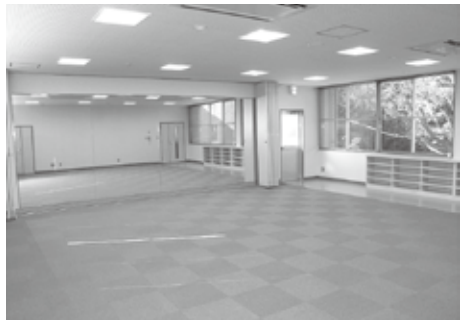
▲スポーツコミュニティセンター整備事業