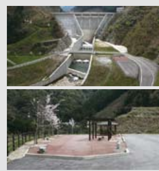
▲ダム下流側には水辺空間を整備

このダムの建設に際しては、自然環境との調和に配慮したさまざまな取り組みが行われ、また、完成後にはダムの下流側に、人々が集うことのできる広場や遊歩道なども整備されました。