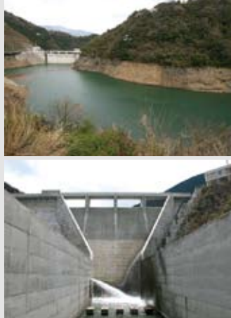
▲ダム湖(上)と高さ48mもある堤体

道前平野では古くから農業が盛んでしたが、降水量が少なくしばしば干ばつ被害を受けていました。そこで、昭和