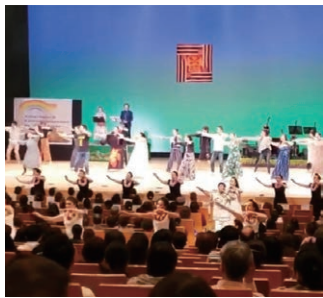
みんなで楽しく踊りましょう