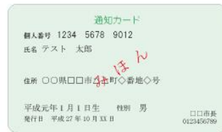
(表面) 通知カード (裏面)