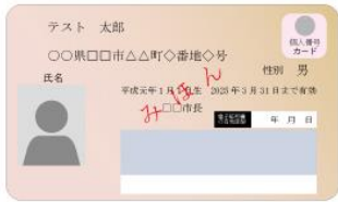
(表面) 個人番号カード (裏面)