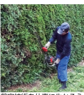
剪定技術を仕事に生かそう

▼対象 60歳以上でシルバー人材センターの会員になり就業を希望する方 ▼日時 1月21日(火)・28日(火) 9時～16時 ※天候などで日時の変更あり ▼場所 西条市シルバー人材センター 1ほか ▼内容 剪定作業に伴う基本的な道具の使い方、雑木・松の剪定・清掃などを実習で習得。 ▼定員 15人 ▼申込方法 次の日時にセンターで申し込み。 1月7日(火)～10日(金) 13時～16時 ※印鑑を持って、本人がお越しください。 西条市シルバー人材センター(小松総合支所内) TEL0898-76-13670