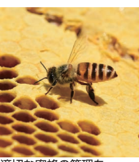
適切な蜜蜂の管理を

蜜蜂を飼育する方(趣味を含む)は、法律により毎年、養蜂飼育届を提出する必要があります。様式は提出先にあるほか、愛媛県ホームページからダウンロードできます。 ▼提出期限 1月17日(金) ▼提出先・問合せ 市庁舎本館3階農水振興課 TEL0897-52-11216 各総合支所 農林水産課