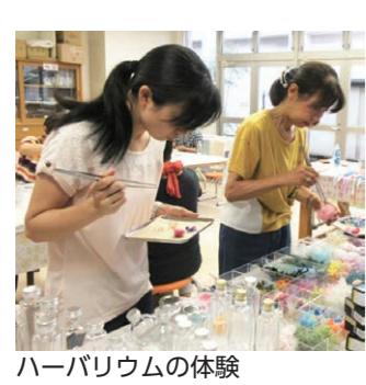
ハーバリウムの体験

東予北地域交流センター 作品展示発表会 ▼日時 1月26日(日) 10時～15時 ▼場所 東予北地域交流センター ▼内容 東予北地域交流センター ○作品展示 パッチワーク、エコクラフト、革細工、陶芸、トールペイント、幼児クラブ、母親クラブ ○ワークショップ(当日10時から受付) ハーバリウム、多肉植物の寄せ植え、エコクラフトのうさぎ雛リリース、トールペイントのミニお雛様 ※各ワークショップは定員・参加費あり。詳しくはお問い合わせください。 ○陶芸作品販売など ◎東予北地域交流センター Tel.0898-66-14185