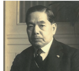
台湾電力の父「松木幹一郎」