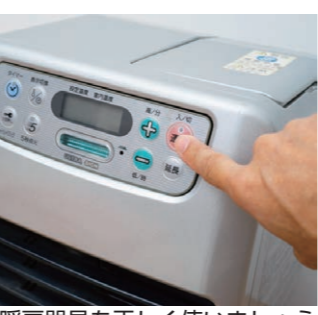
暖房器具を正しく使いましょう

寒さが厳しい季節、暖房器具による火災を防ぐために、正しい取り扱い方法を再認識しておきましょう。 暖房器具の火災を防ぐ3つのポイント! 給油・移動時は完全消火のため、必ず火を消し、消火したのを確認しましょう。 周囲には物を置かない スプレー缶などをストーブやファンヒーターの近くに放置すると、破裂・爆発の恐れがあります。また、カーテンや衣類・布団などの近くでは使用しないようにしましょう。 人の目のある場所で使う