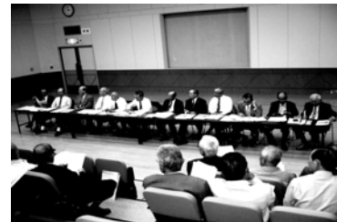
平成18年10月24日～25日 松江市

かねてより予定されていた、島根県松江市を先進地視察研修として訪問しました。 松江市では、平成17年4月に周辺7町村と広域合併し、町内会、自治会組織も連合組織に統合され、本市とよく似た状況にあるが、市民と行政の協働体制を作りつつあり、年度交代著しい自治会のために「自治会長の手引き」を作成配布するなど特筆すべき努力も見られて、得るものが多い研修となりました。