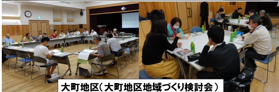
大町地区(大町地区地域づくり検討会)