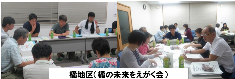
橘地区(橘の未来をえがく会)