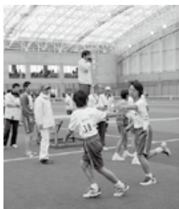
▲前回の駅伝競走大会(東予会場)の様子