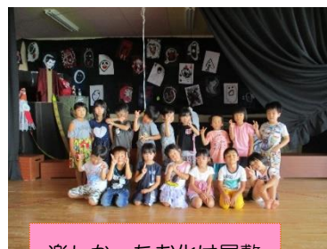
楽しかったお化け屋敷