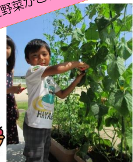
夏野菜がとれたよ