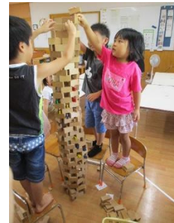
大好きなお友達と…