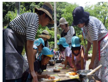
親子活動(ピザ作り)