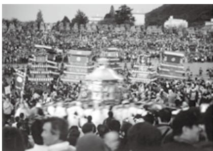
▲昨年のコンテストで「推薦」に輝いた作品 題/クライマックス