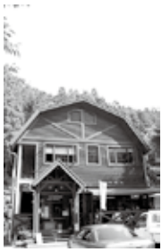
自然体験を科学する石鎚ふれあいの里へぜひお越しください。