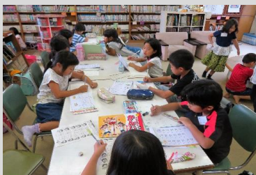
(宿題をしている様子)