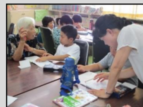
(丁寧に教えてくれます)