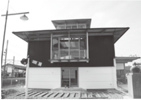
▲十河信二記念館整備事業