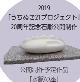
2019 「うちぬき21プロジェクト」 20周年記念石彫公開制作 公開制作予定作品 「水脈の座」