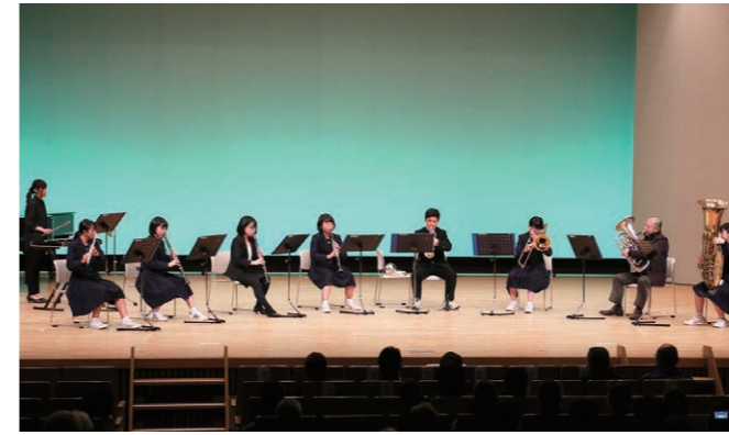
小松高校吹奏楽部による美しいアンサンブル演奏