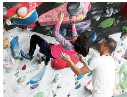
熱心に平山先生から学ぶ子どもたち

3月21日、2度のワールドカップで総合優勝した平山ユージ先生を迎えて、小中学生を対象としたスポーツライミング教室を開催。先生から技術を学んだ子どもたちが、クライミング競技を楽しんでいました。