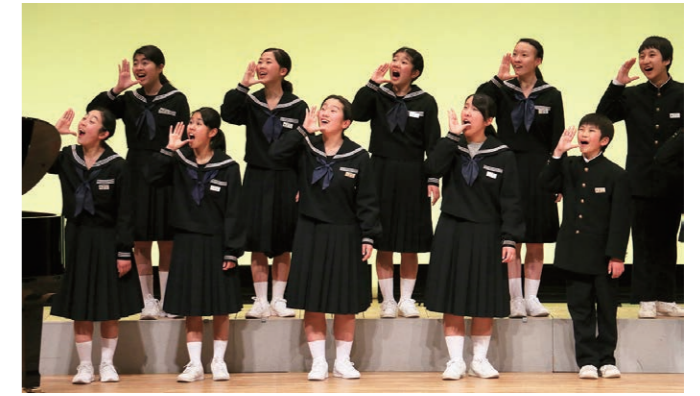
西条北中学校合唱部はきれいな歌声を響かせました