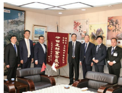
保定市の代表団の皆さん

3月27日・28日の2日間、当市と友好都市提携を締結してから25周年という節目の年を迎えた中国・保定市の代表団が来西。市役所で市長と意見交換したほか、石鎚クライミングパークSAIJOなど市内各地を視察しました。