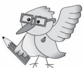
西条市議会 マスコットキャラクター みずき議員

市議会では、限られた会期中で多くの議案を審議するため、複数の委員会を設置し、本会議での議決に先立ち、専門的かつ詳細な審査を行っています。