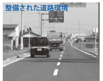
整備された道路環境 は、合併時からの継続事業でした

■道路網の整備 市民生活の利便性等の向上を図るため、計画的で効率的な道路網の整備を進めています。市道で