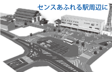
センスあふれる駅周辺に

近年問題となっている中心市街地の空き店舗の増加や通行量の減少に対して、総合福祉センターおよび西条駅周辺の新しい拠点整備を行い、それらを結ぶ回遊性のある道路整備を行うことで賑わいの再生を図ります。特に駅周辺については、現在建設中の観光・交流施設の今秋のオープンに合わせ、駅前広場と東側の広場整備を行っています。なお、駅前広場の全面完成は来年度を予定しています。