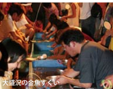
大盛況の金魚すくい