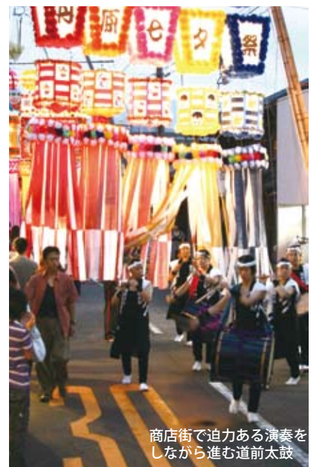
商店街で迫力ある演奏を しながら進む道前太鼓