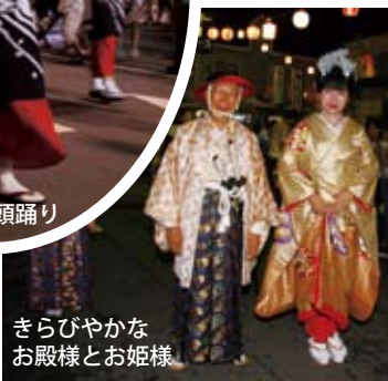
きらびやかな お殿様とお姫様