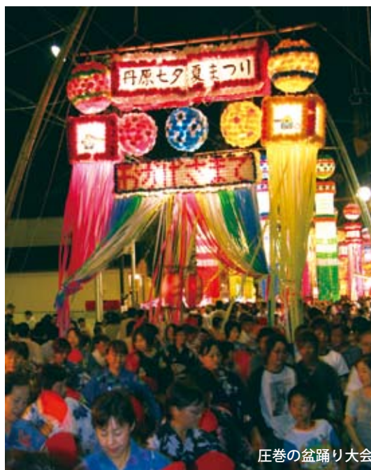
庄巻の盆踊り大会