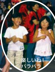
楽しいね！ パラパラ