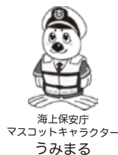
海上保安庁 マスコットキャラクター うみまる