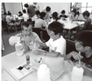
▲ 興味津々の子どもたちと熱心に指導をするクラレ西条の職員の方々

7月31日、市内の小学5・6年生34名が参加し、クラレ西条(株)で、「プラスチックフィルムってどんなもの？」をテーマにわくわく化学教室&工場見学を開催しました。 わくわく化学教室&工場見学は、子どもたちに化学のおもしろさを知ってもらうことを目的に、年3回開催するものです。子どもたちからは、「僕たちの身近なところに、化学というものがあることがわかった」「化学には興味がなかったけど、わくわく化学教室で好きになりました」などの感想が聞かれました。 今年度のわくわく化学教室&工場見学は、12月1日と2月16日に予定しています。