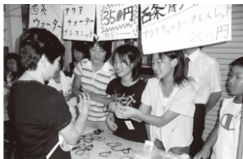
▲ 「いかがですか？」と商品を勧める子どもたち

7月31日、市内の小学5・6年生34名が参加し、クラレ西条(株)で、「プラスチックフィルムってどんなもの？」をテーマにわくわく化学教室&工場見学を開催しました。 わくわく化学教室&工場見学は、子どもたちに化学のおもしろさを知ってもらうことを目的に、年3回開催するものです。子どもたちからは、「僕たちの身近なところに、化学というものがあることがわかった」「化学には興味がなかったけど、わくわく化学教室で好きになりました」などの感想が聞かれました。 今年度のわくわく化学教室&工場見学は、12月1日と2月16日に予定しています。