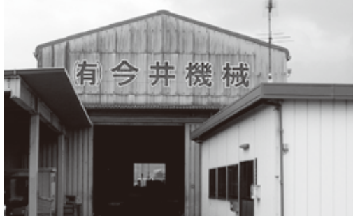
有限会社 今井機械