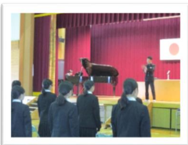
丹原西中学校 卒業生による合唱の様子