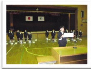
中川小学校 卒業生による別れの言葉の様子

3月15日（金）に丹原西中学校23名、3月22日（金）に中川小学校22名の卒業証書授与式が行われました。卒業生の皆さん、ご卒業心よりお祝いを申し上げます。 学校生活でのたくさんの思い出を大切に、いろいろな出会いや経験を重ね、充実した毎日になりますように。