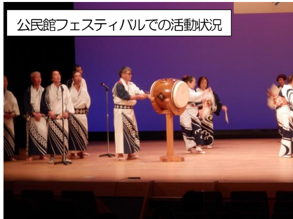
公民館フェスティバルでの活動状況