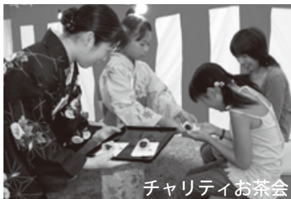
チャリティお茶会