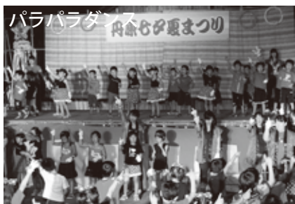
パラパパラダンス 丹原七夕夏まつり