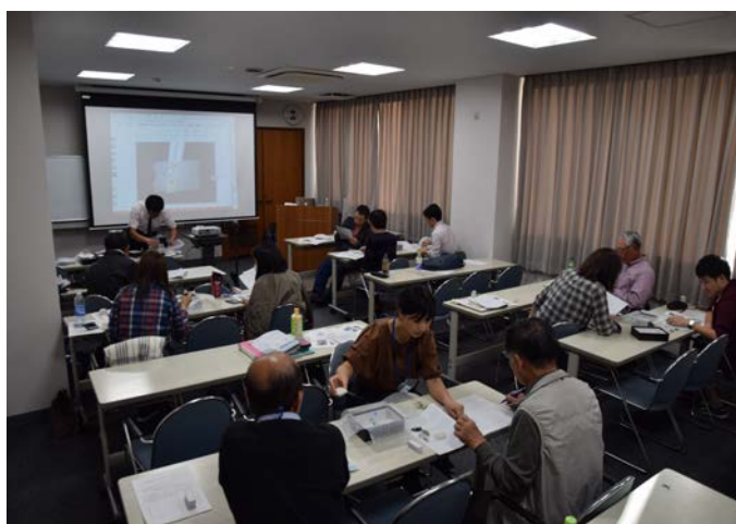
様々な年代の受講者が学んでいます