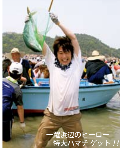
一躍浜辺のヒーロー 特大ハマチゲット!!