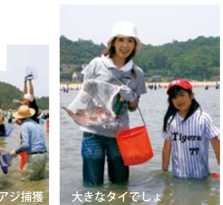
大きなタイでしょ