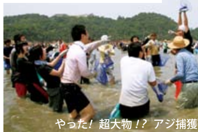
やった! 超大物!? アジ捕獲

今年初の真夏日となったこの日、市内外から約8千人が参加し、7回目となる「立て干し網」が河原津海岸で盛大に開催されました。放流されたハマチ、タイ、アジなど約2万匹とアサリ約2tをめざして参加者が一斉に海に全力疾走。家族連れや友達同士など、水しぶきと歓声を上げながら、楽しい一日を過ごしていました。