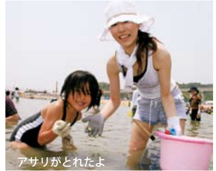
アサリがとれたよ