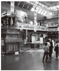
▲昨年に実施された松山空港ビルロビー展の様子