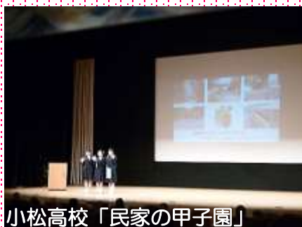
小松高校「民家の甲子園」

禎瑞からは「フォト秋桜」さんに 写真を展示していただきました。 前日から準備していただきありが とうございました。 ご来場いただきましたみなさまも 雨の中、ありがとうございました!