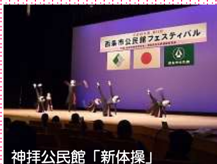
神拝公民館「新体操」