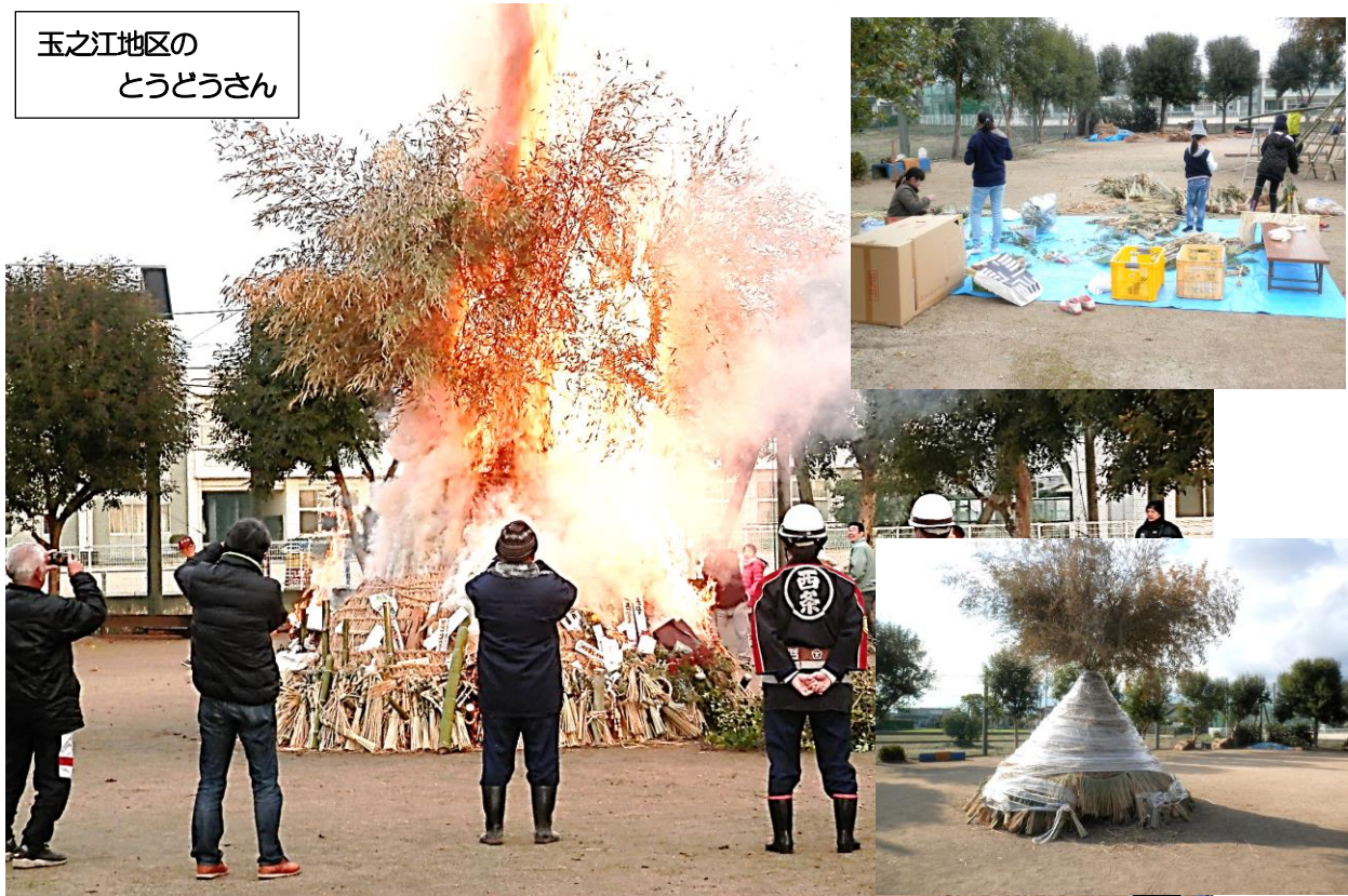
玉之江地区の とうとうさん

平成31年1月6日（日）に、吉井地区の5か所で小正月の伝統行事である「とうとうさん」づくりが行われました。