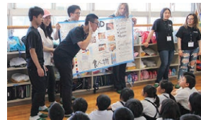
(左) 2017年のサンフランシスコでの交流 (中) 当市を訪れたサンフランシスコの学生たち (右) 西条市内の小学生たちと交流