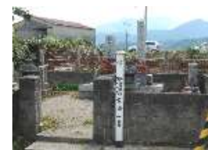
◀周布文化財保護委員会▶

大正13年1月1日周布村吉田に生まれる。周布尋常小学校を優等で卒業、後に呉の海軍工廠に勤める傍ら夜間広島工業学校に入学して勉学に励む。昭和18年海軍航空隊入隊後二等兵曹に進級し、昭和20年4月6日には神風特別攻撃隊第一草薙隊の一員として沖縄海上にて米軍艦船に体当たり名誉の戦死をした。功績により二階級特進功四級勲6等海軍少尉に任じられた。辞世の句として「おくれなば梅も桜もおとるべし、さきがけてこそ色も香りもあれ」がある。