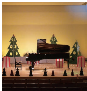
多様な音色をお楽しみに