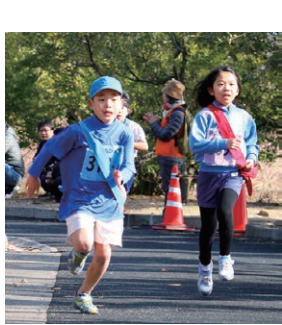
力を合わせて駆け抜けよう

▼学年・距離 ○小学1・2年生 2・2km ○小学3・6年生 4・2km ▼申込方法 市内各小学校に12月12日(水)までに申し込み。 市庁舎新館2階 スポーツ健康課 Tel0897-5211255