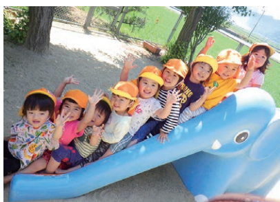
申し込みはお忘れなく