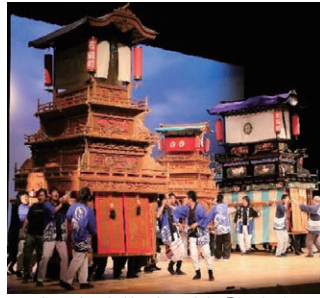
平成28年人権啓発劇「希望」