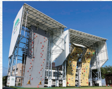
石鎚クライミングパークSAIJO改修事業