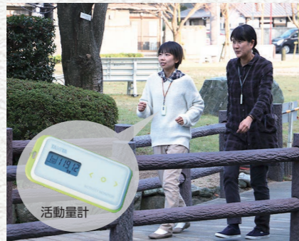
スマートシティ構築トライアル事業 （わくわく健康ポイント事業）