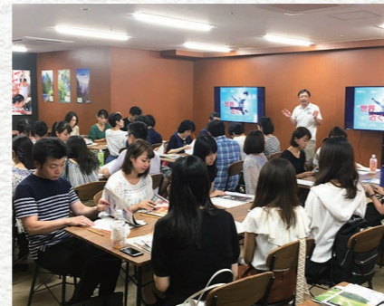
移住促進事業 ※写真は東京で開催された移住セミナー