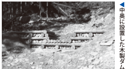
▶中奥に設置した木製ダム