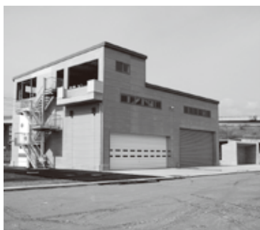
▲第二次出動車両を収納する別棟車庫。