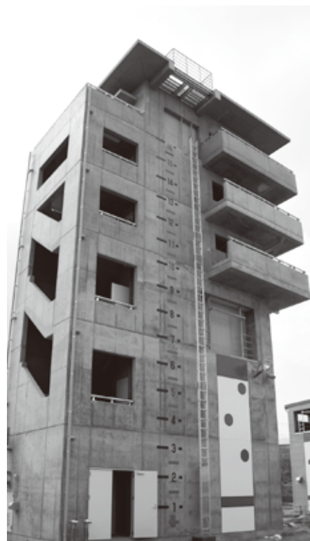
▲各種災害に対応できる技術を養成するための訓練棟（6階建て）。