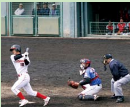
日産自動車九州 対 四国銀行

西条市では、石鎚山系を代表とする恵まれた自然環境、特に1500m級の高地トレーニングに最適な環境や観光資源、東予運動公園内に建設を予定している屋内体育施設を含む各種体育施設などの豊富な地域資源を連携活用することにより、「スポーツ競技力の向上」「市民の健康増進」を図り、交流人口の拡大による関連産業の振興を目的としたスポーツ交流を核にしたまちづくり「合宿都市構想」がスタートしました。 今年、2月から3月にかけて社会人や大学など9チームが、延べ58日間に渡り「ひうち球場」「東予運動公園野球場」「ひうち陸上競技場」でシーズンインを前にみっちり汗を流し、からだを作っていました。 また、この間には、フットサル、サッカー、野球、ソフトボールの教室も開かれ、地元の子どもたちがあこがれの選手と楽しく交流し、指導を受けていました。 今回は、西条市で合宿をしたアスリートたちの様子を紹介します。