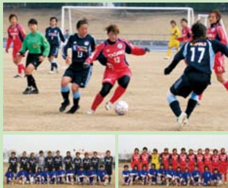
TASAKIペルーレFC 対 岡山湯郷Belle