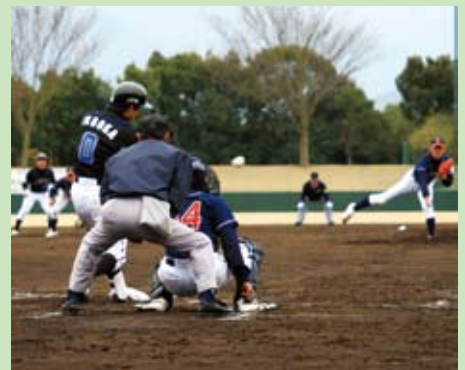
拓殖大学 対 J F E