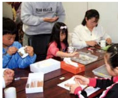
▲ ポーセラーツ体験(西条公民館)