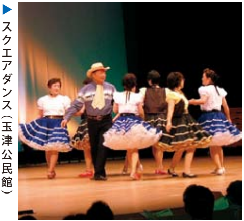
▶スクエアダンス(玉津公民館)

「あつまる」「まなぶ」「つなぐ」を合言葉に、市内の全公民館が集い、公民館フェスティバルが開催されました。 公民館で活動する各サークルが、「舞台発表」「作品展示」「体験コーナー」で日ごろの活動成果を披露するとともに、サークル相互の交流も深めました。 会場には二日間で約二三〇〇人が訪れ、プロ顔負けの作品や演技に触れながら、文化の香りを楽しみました。