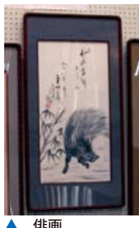
▲ 俳画(壬生川公民館)