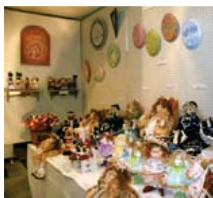
▲ カントリードール・トルバイント(吉井公民館)

市内の公民館では、各種講座やサークル活動を行っています。皆さんも新しい自分を公民館で発見してみませんか。 詳しくは、お近くの公民館へお問い合わせください。