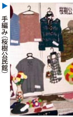
▶手編み(桜樹公民館)