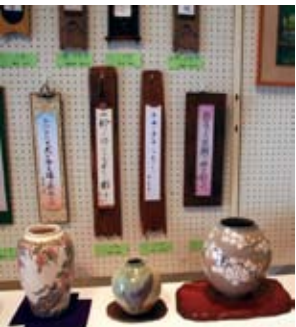
▲ 陶芸・川柳(小松公民館)