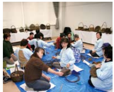
▲ かずら細工体験(大保木公民館)