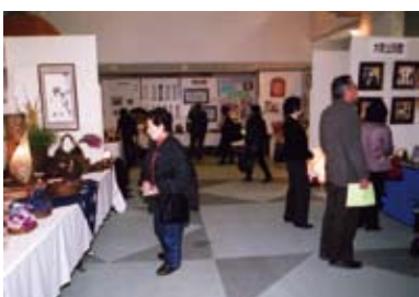
▲ 素晴らしい作品に見入る来場者