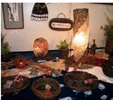
▲ かずら細工・水墨画(橘公民館)